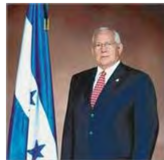
Roberto Micheletti Presidente del Congreso